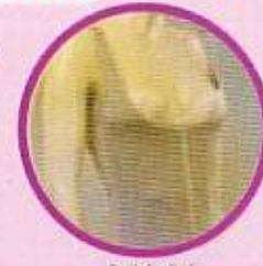
Far Intra Red